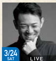
3/24 SAT LIVE シンガーソングライター 河口恭吾