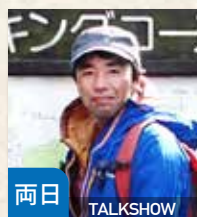
両日 TALKSHOW 登山家 山野井泰史