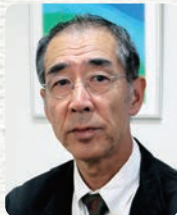
社会福祉法人 青葉仁会