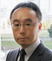
厚生労働省 社会・ 援護局 障害福祉課