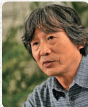
株式会社モンベル