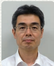
国土交通省 近畿地方整備局